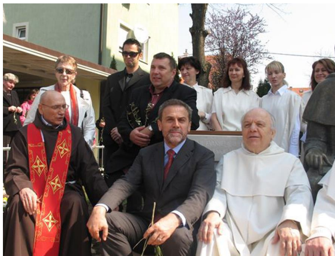
Fra Nedjeljkov posljednji javni nastup na Cvjetnicu 5. travnja 2009. u prigodi otkrivanja spomenika bl. Augustinu Kažotiću pred crkvom na Kajzerici

Na drugi dio pitanja odgovorio bih ovako: Ako nisi spreman da ti netko za učinjeno dobro uzvrati zlom, onda nemoj činiti